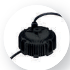
Driver Mean Well