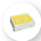
Nichia LED Chip